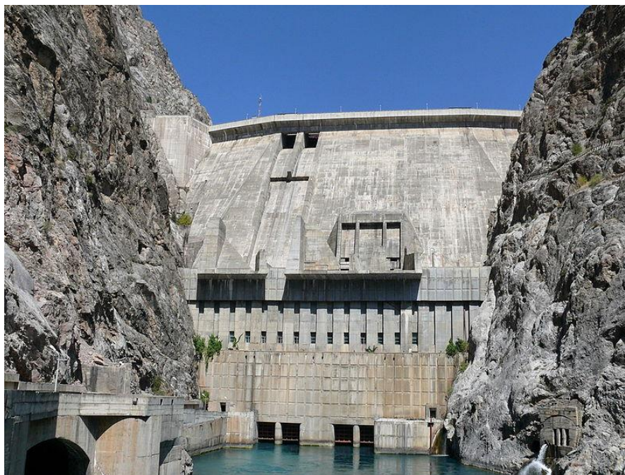
Рисунок 1. Плотина Токтогульской ГЭС